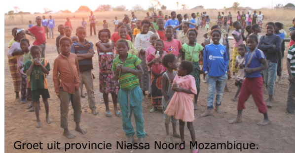
Groet uit provincie Niassa Noord Mozambique.

SODA werkt momenteel aan een project in Mecula, dit ligt in het noordelijkste gedeelte van Mozambique tegen de grens van Tanzania. Ter ondersteuning van het lokale ziekenhuis hier, zal er een tandartsruimte, onderzoekskamer en spreekkamer worden gebouwd. Ook zal er een vergaderzaaltje en een ruimte voor een apotheek worden gemaakt. Het bouwteam hiervoor zal uit 8 lokale medewerkers bestaan.